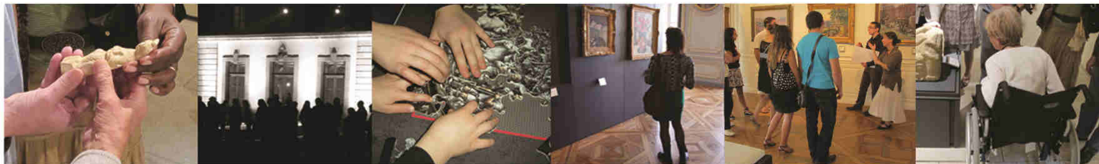
Photo d'une visite sensorielle...