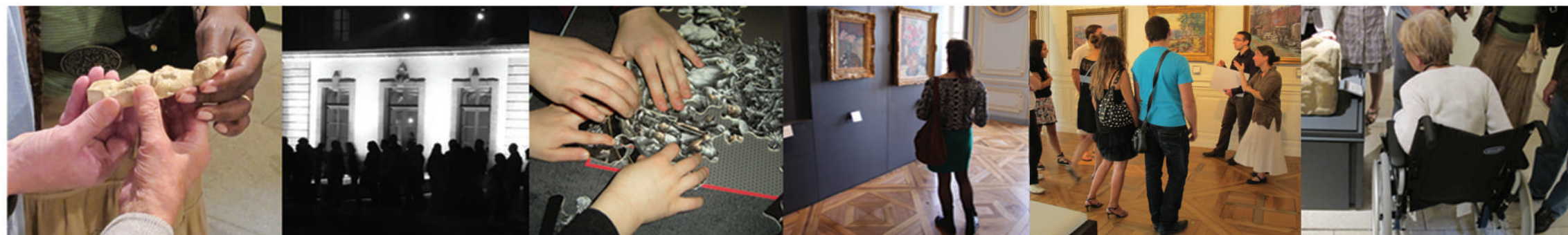
Photo d'une visite sensorielle...

L'ensemble du musée est accessible grâce à des rampes d'accès et des ascenseurs .