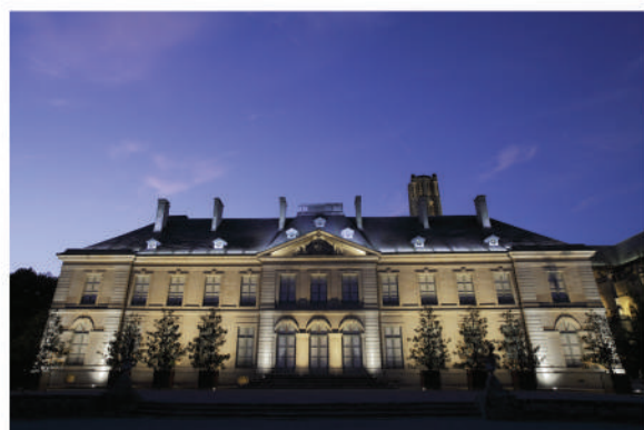
© Musée des Beaux-Arts - Ville de Limoges - V.Schrive